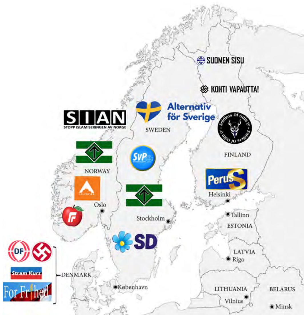
Eskandinaviar herrialdeetako parlamentuko eta parlamentuz kanpoko ultraeskuinaren mapa.

maren eta LGTB eskubideen aurka egiten du era basatian. NMRk manifestazio publikoak antolatzen ditu, propaganda banatzen du eta biolentzia ekin-tzei lotuta dago, baita migratzaileen eta ezkerreko aktibisten aurkako erasoei ere. Finlandian debekatu izan eta AEBko Estatu Sailak Munduko Antolakunde Terroristen zerrendan sartu duen arren, NMRk erdi ezkutuan jarduten jarraitzen du. Haren antolakuntza-egitura sendoak eta sare sozialen erabilerak eskualdeko ultraeskuineko eragile arriskutsuenetarikoa bihurtzen du.